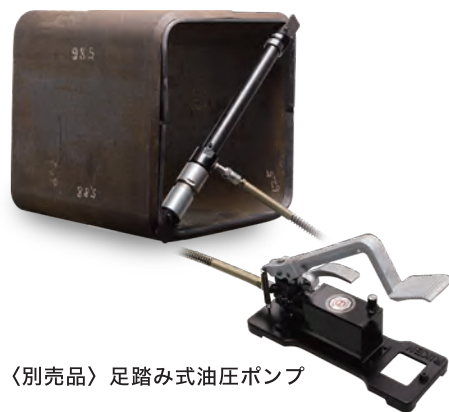
〈別売品〉足踏み式油圧ポンプ